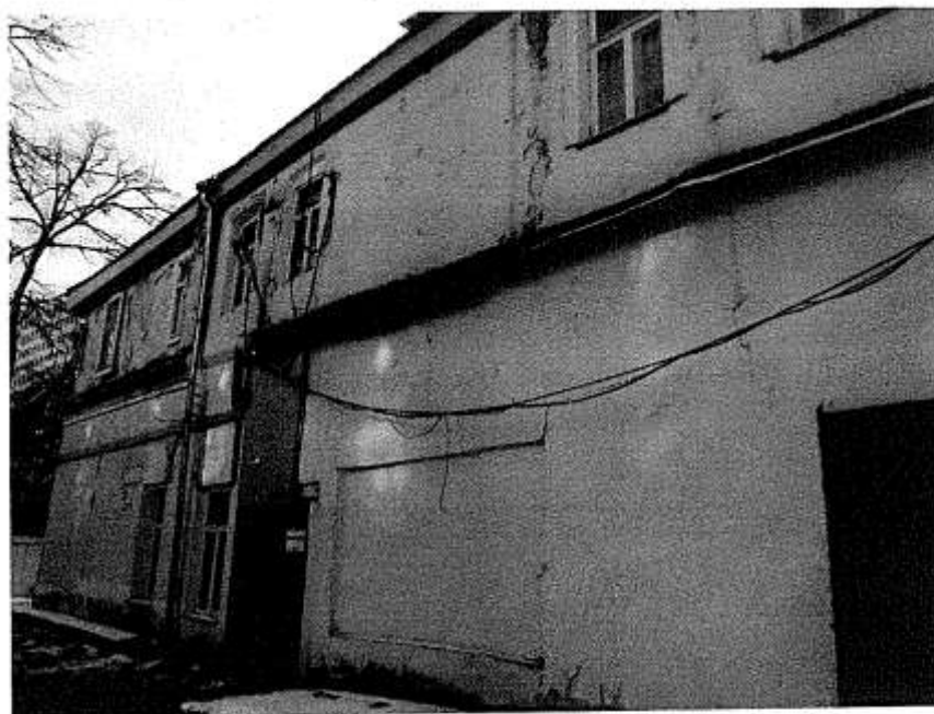
Фото № 3. Дворовый фасад, вид с северо-западной стороны.