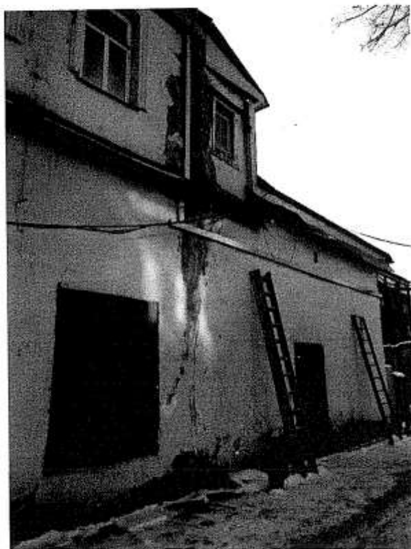
Фото № 4. Западный фасад.