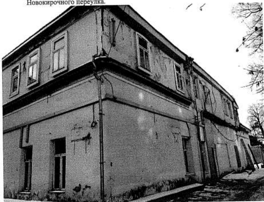
Фото № 2. Вид с северо-восточной стороны (дворовый фасад).